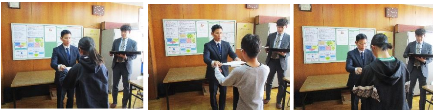
← 税に関する書道展表彰式

長い2学期でしたが、児童の文化面での活躍が多く見られました。ホームページでも、なるべくお伝えはしておりますが、2学期の表彰等の様子をお知らせします。